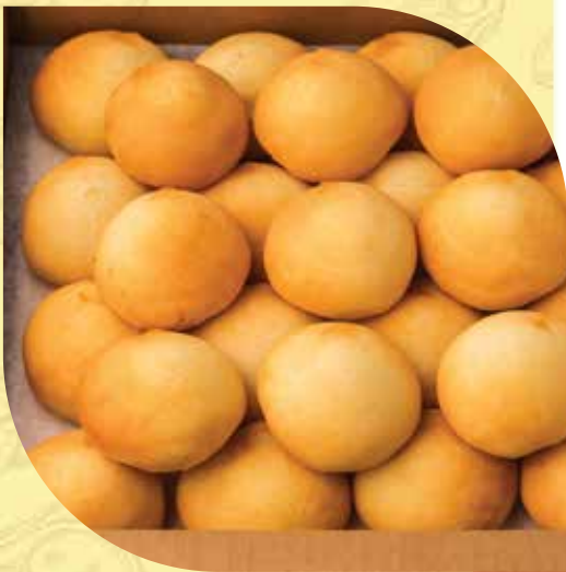
PANDEBONO CHEESE BREAD