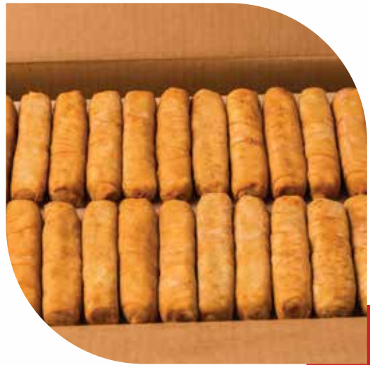
TEQUEÑOS CHEESE STICKS